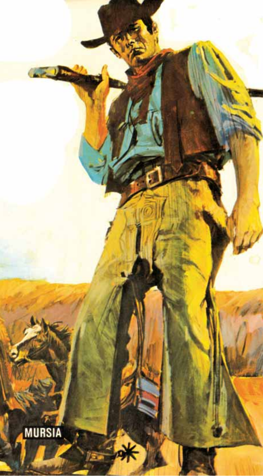
Illustrazione di Uggeri