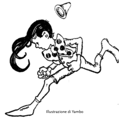
Illustrazione di Yambo

Ricordare i Grandi della letteratura italiana per l'infanzia attraverso la ricerca e la riscoperta dei più importanti prodotti culturali per ragazzi (romanzi, fumetti, illustrazioni), che maggiormente hanno contribuito a formare lo spirito italiano, dai primi anni dell'Unità fino ad oggi (ad es. Collodi, De Amicis, Vamba, Salgari, Calvino, Rodari...); Leggere la letteratura per ragazzi come riflesso della società italiana , avvicinando e confrontando costantemente queste opere con l'epoca in cui sono nate e si sono diffuse, per evidenziarne i punti di contatto. Ad esempio Cuore è uno spaccato perfetto dell'Italia Umbertina, così come Gian Burrasca riflette e critica quella giolittiana.