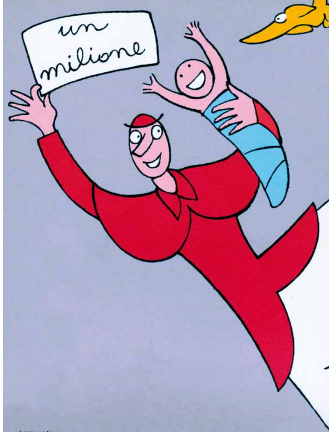
Illustrazione di Sto

Parallelamente agli arazzi, dove possibile, sono esposti in un percorso studiato i volumi d'epoca patrimonio della biblioteca ospitante.