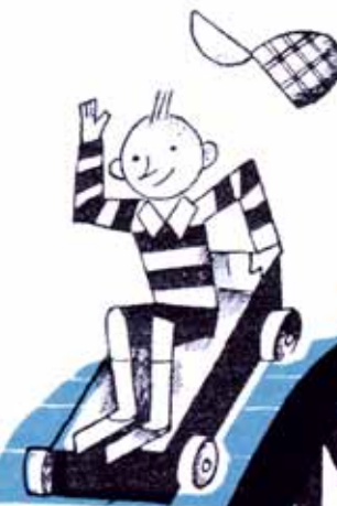
Illustrazione di Bisi