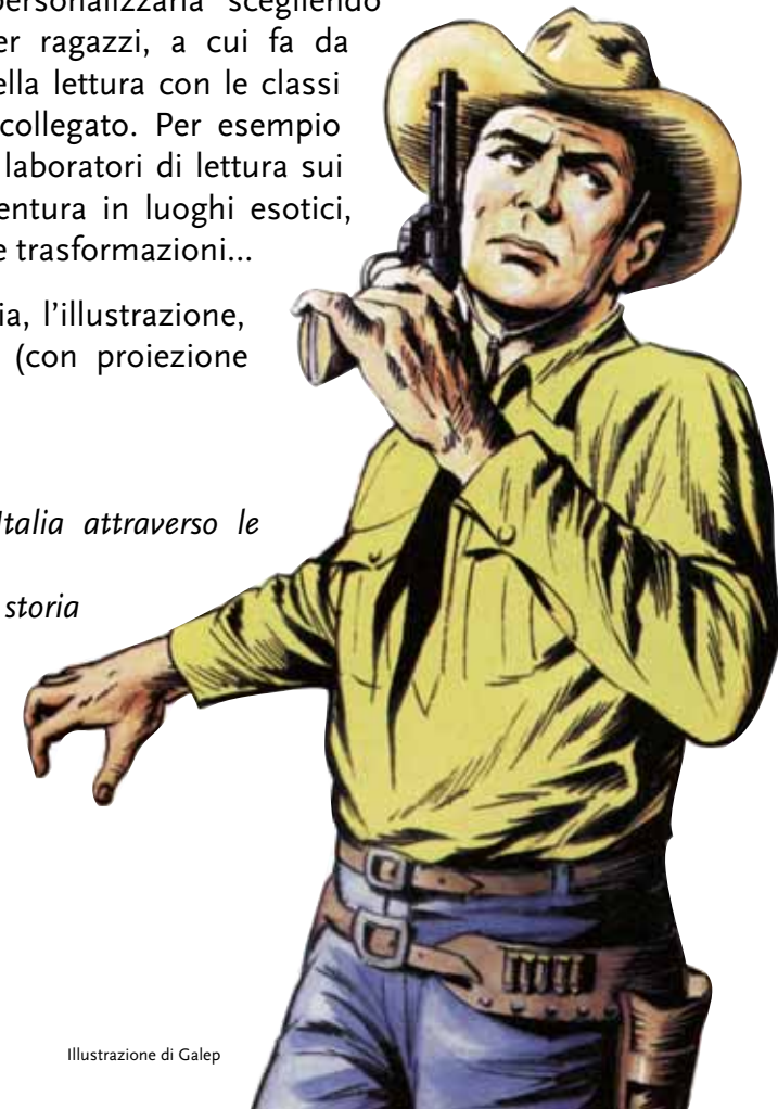
Illustrazione di Galep