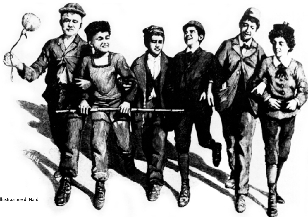
Illustrazione di Nardi

Basterebbe citare Pinocchio o Cuore per rendere espliciti quanto certi testi hanno contribuito alla formazione di un popolo, ma i riferimenti possibili sono davvero tantissimi: certe illustrazioni di copertina di romanzi o riviste, o la grafica di alcune collane storiche ( La scala d'oro Utet, La Biblioteca dei miei ragazzi Salani...), hanno un sapore ben chiaro e vivo in moltissime memorie. Le fantasie di Calvino o Rodari hanno senza dubbio avuto dirette influenze sulla scuola e sulla didattica italiana; e del resto è sufficiente notare quanto la figura di Sandokan si sia misteriosamente sovrapposta a quella di Garibaldi per avere una dimostrazione lampante di quante storie "finte" e Storia siano collegate.