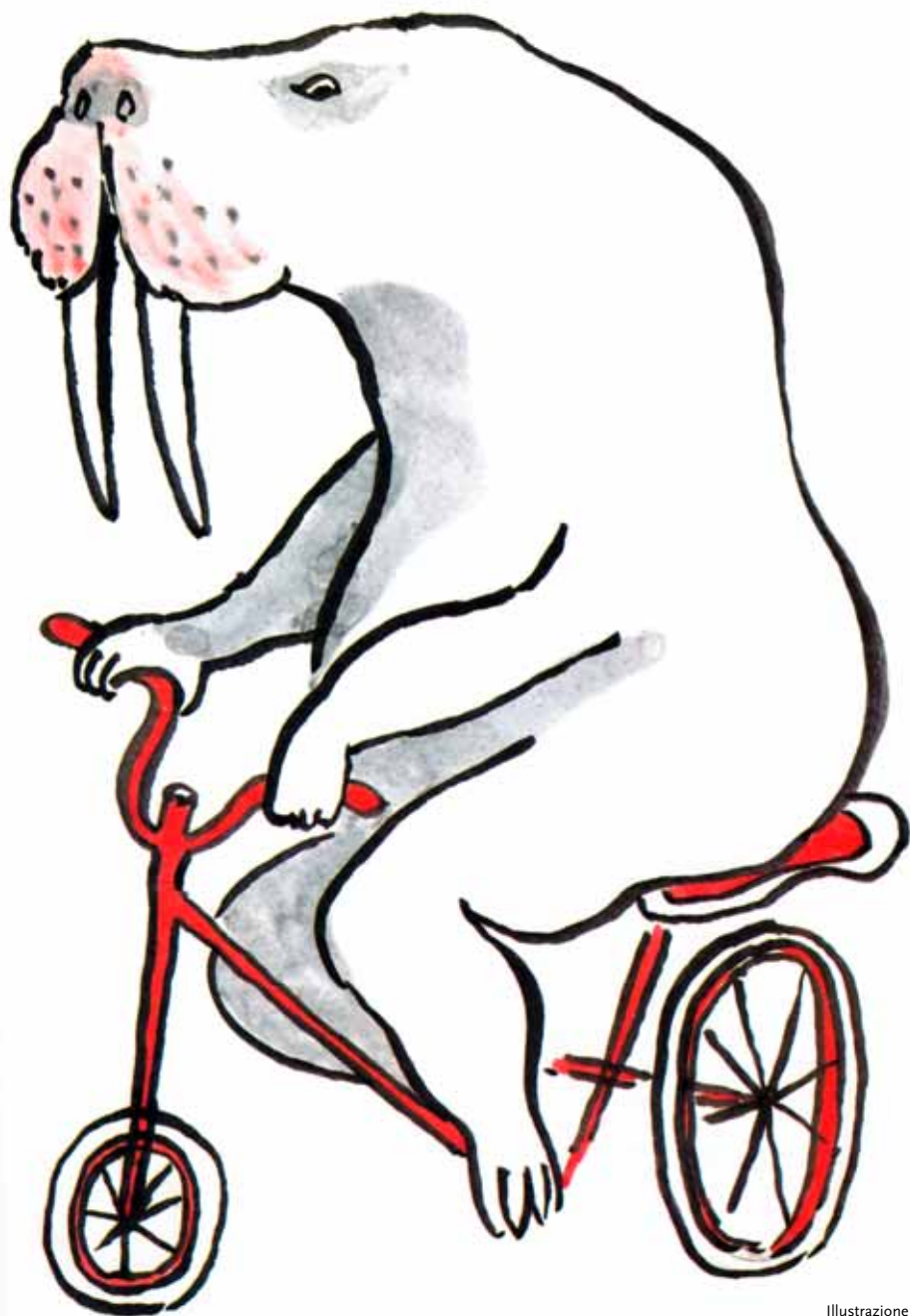
Illustrazione di Scialoja