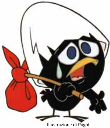
Illustrazione di Pagot

L'esposizione prevede 110 opere, divise in 9 sezioni, una per ogni periodo storico preso in considerazione, e collegate da una "linea del tempo" che scorre a terra.