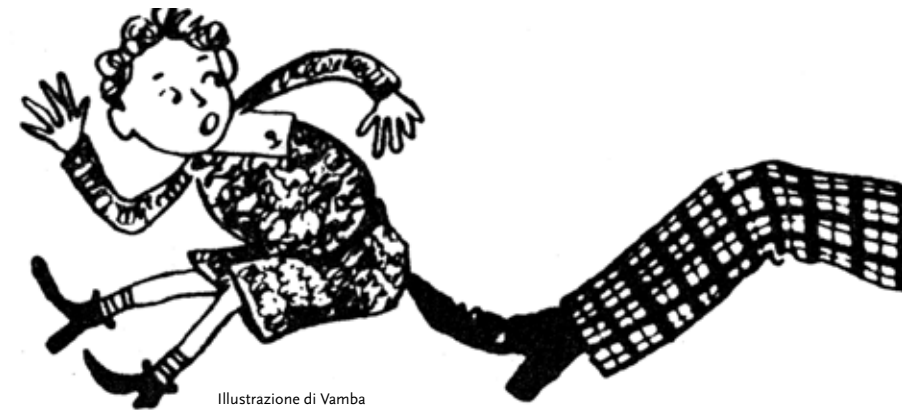
Illustrazione di Vamba