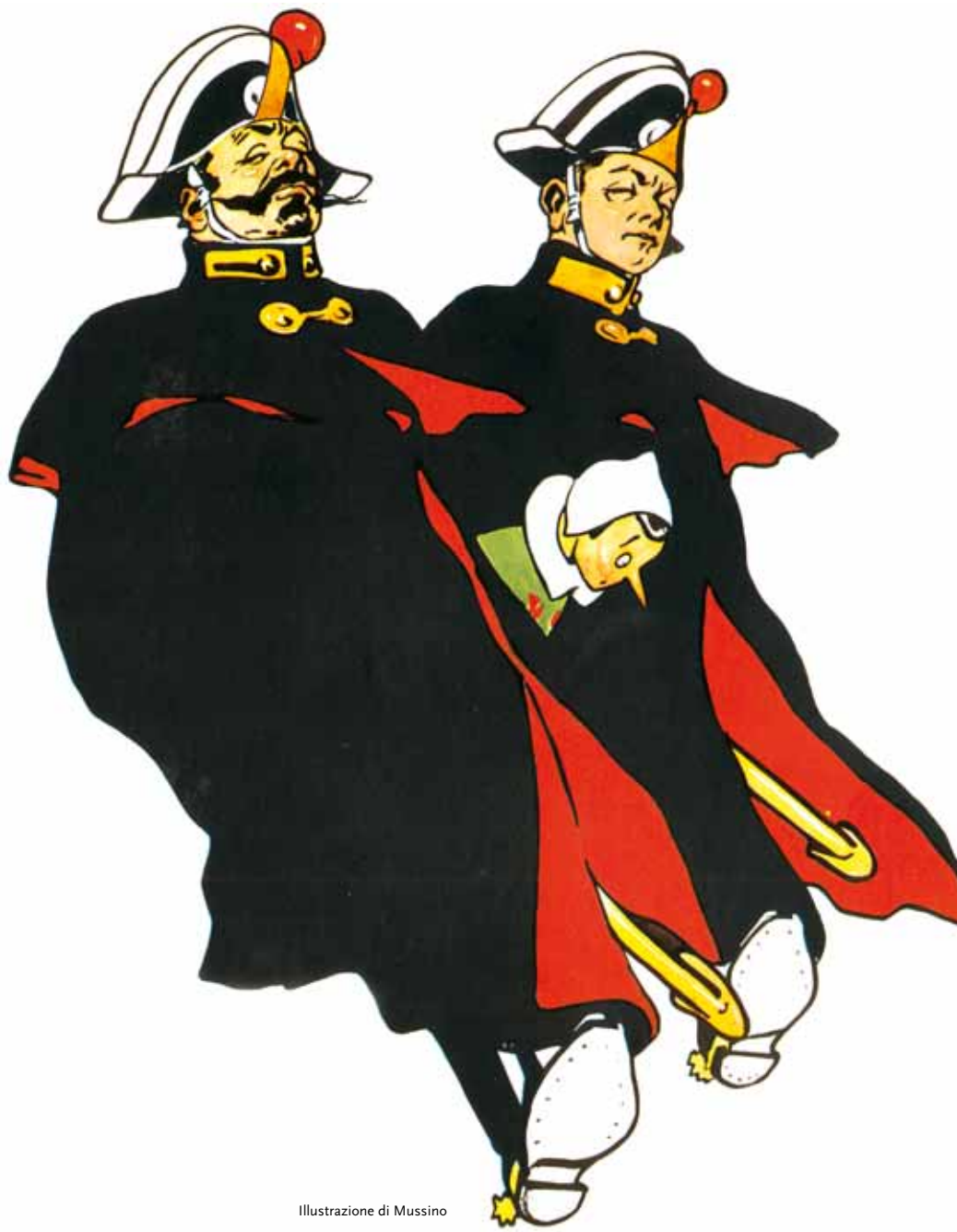
Illustrazione di Mussino