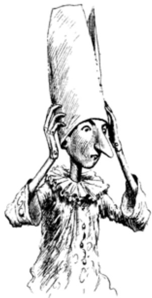
Illustrazione di Chiostri

In occasione del 150° anniversario dell'Unità d'Italia